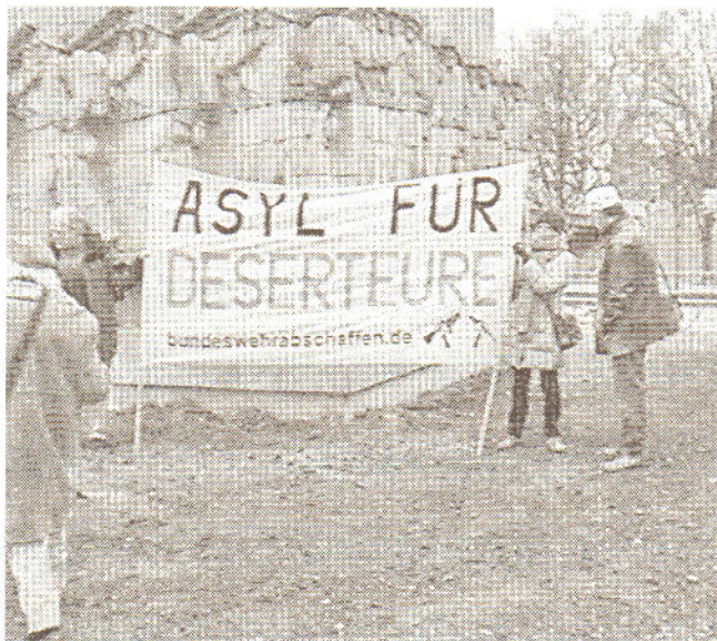
Mahnung vor dem "Kriegsklotz" Hamburg-Dammtor

Auch in diesem Jahr wurde am Vormittag ein gemeinsamer Kranz unter anderen von SPD und CDU dort niedergelegt.